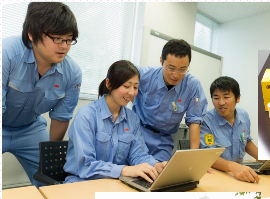
社内は風通しが良く、和気あいあいとした雰囲気。役職名では呼ばず、「〇〇さん」と呼ぶのがスリーエム流。