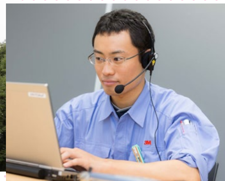
住友スリーエムの開発部との打ち合わせやグループ企業との会議は、インターネット会議が常識。