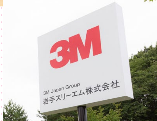
スリーエムといえば、この「3M」の赤色ロゴマークが目印。