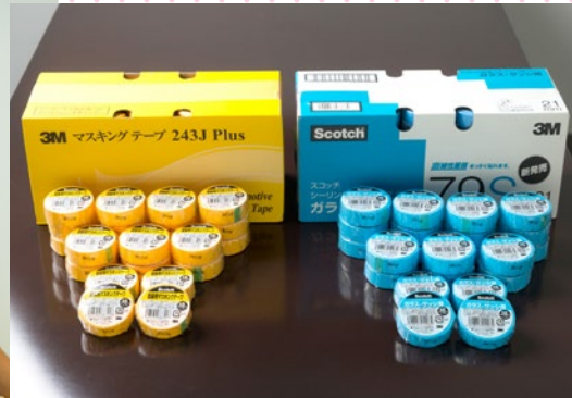
主力商品である建設用のマスキングテープ。産業界で幅広く使われている。