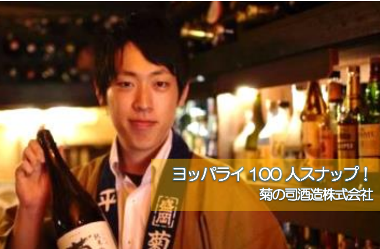
ヨッパライ 100人スナップ！ 菊の司酒造株式会社