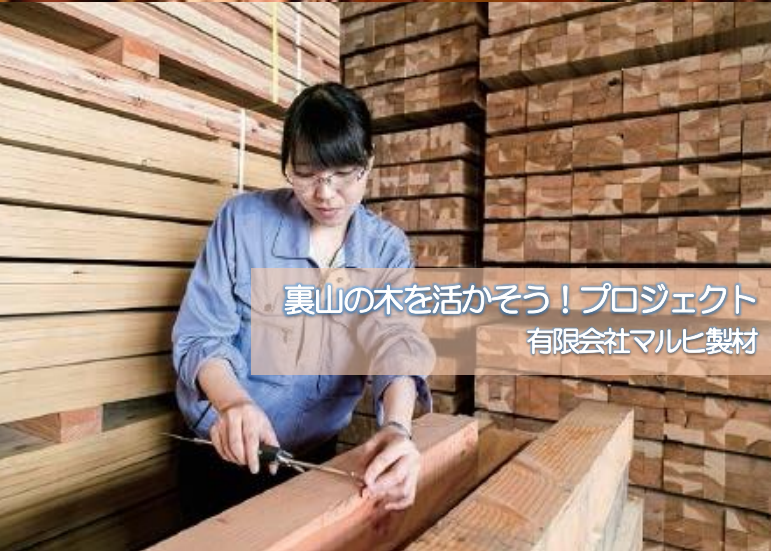
裏山の木を活かそう！プロジェクト 有限会社マルヒ製材