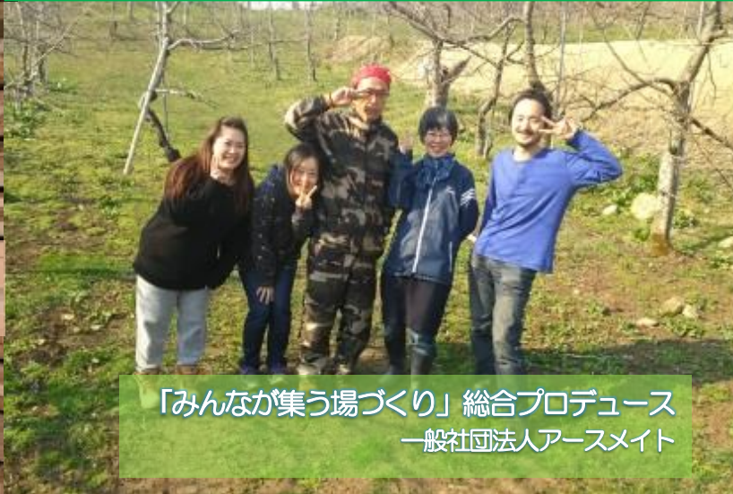
「みんなが集う場づくり」総合プロデュース 一般社団法人アースメイト